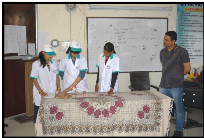
Trainees participating in Micro Lab - Ice Breaking Exercise.