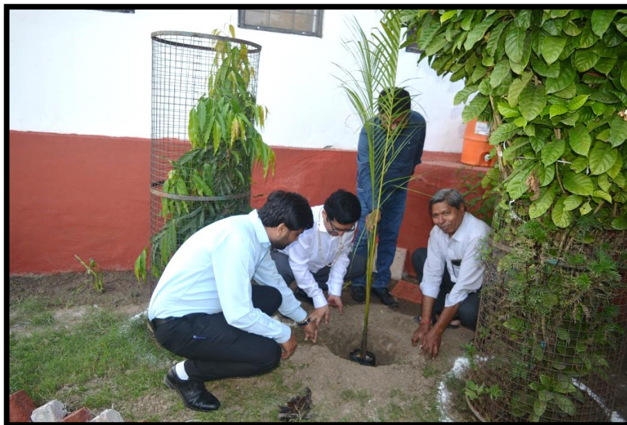
Shri Giridhar Kallapur ED RUDSETI visited our Institute and Planted a plant in the Institute Garden