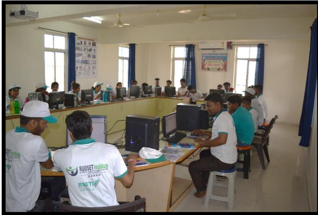
Trainees Participating in the Practical Session of Desktop Publishing Training Programme..