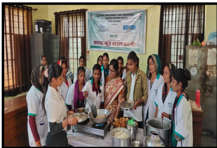
Trainees Participating in the Practical Session of Fast Food Stall Udyami Training Programme..