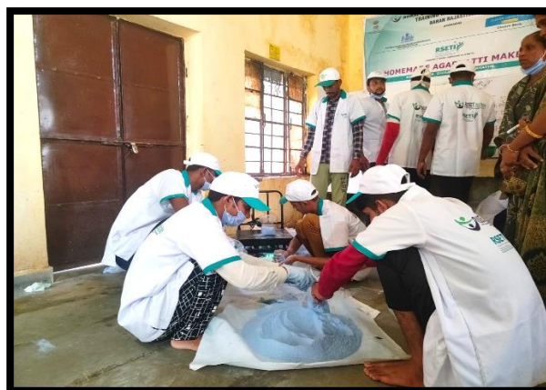
Jail Inmates trainees during the practical session of Detergent Powder Making