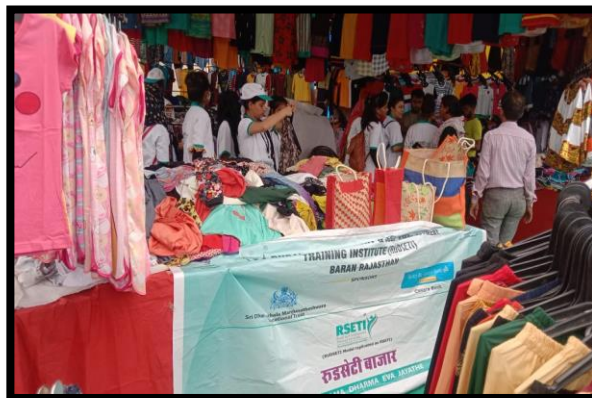
Trainees Participated in RUDSETI Bazaar