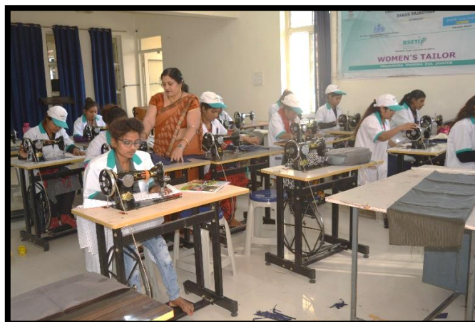
Trainees Participating in the Practical Session of Women's Tailor Training Programme..