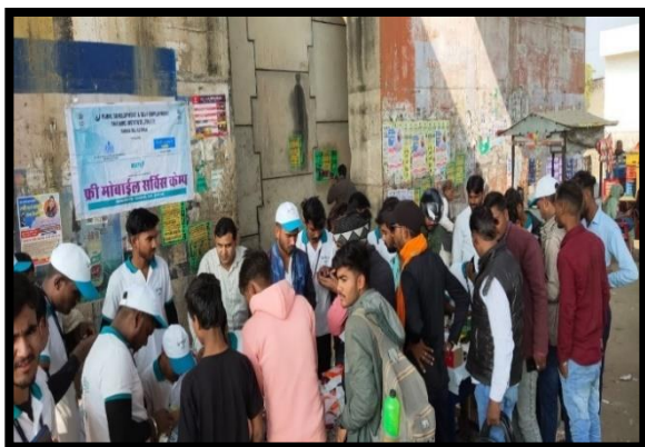
Trainees Participated in Free Mobile Service Camp