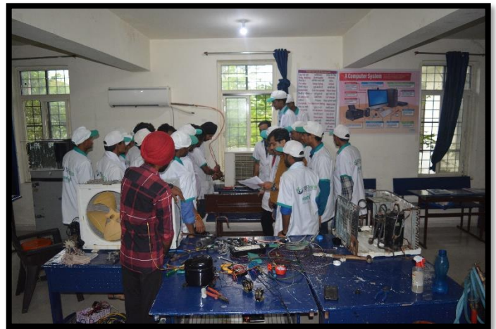
Trainees Participating in the Practical Session of Refrigeration and Air Conditioning Training Programme.