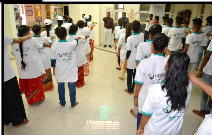
Trainees and Staff taking Integrity Pledge