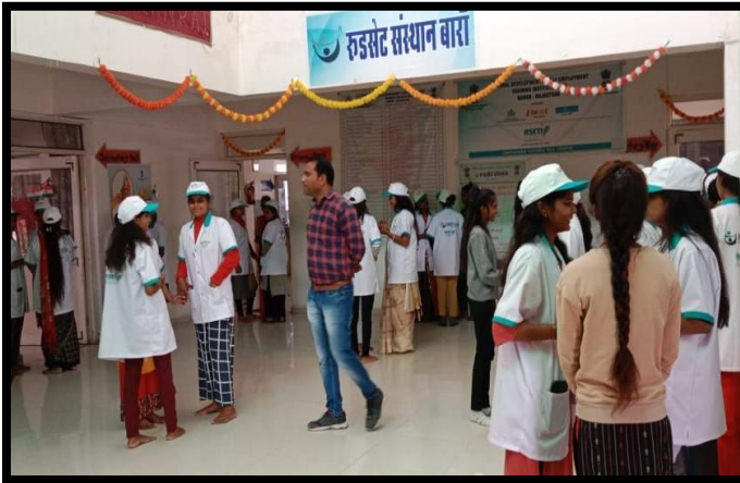
Trainees participating in Micro Lab - Ice Breaking Exercise.