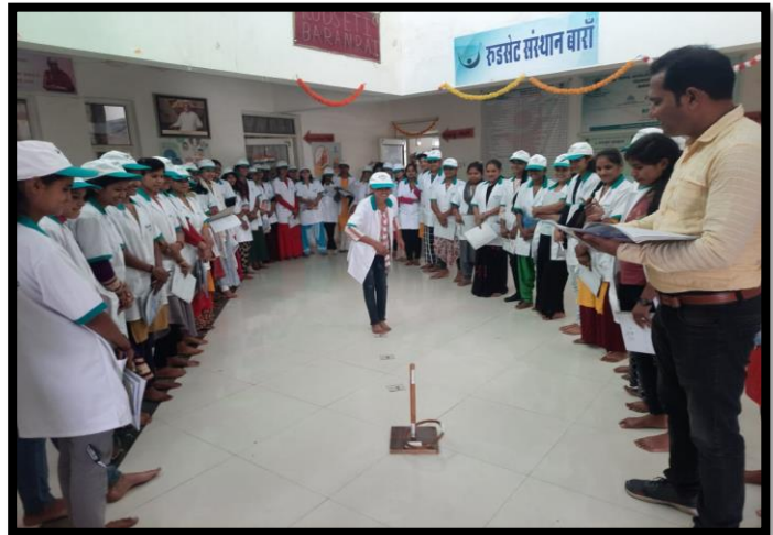
Trainees Participating in Ring Toss Game Exercise.