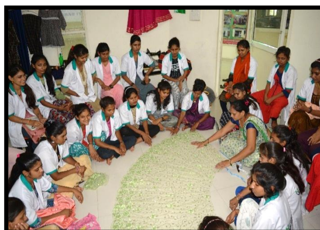
Trainees Participating in the Practical Session of Women's Tailor Training.