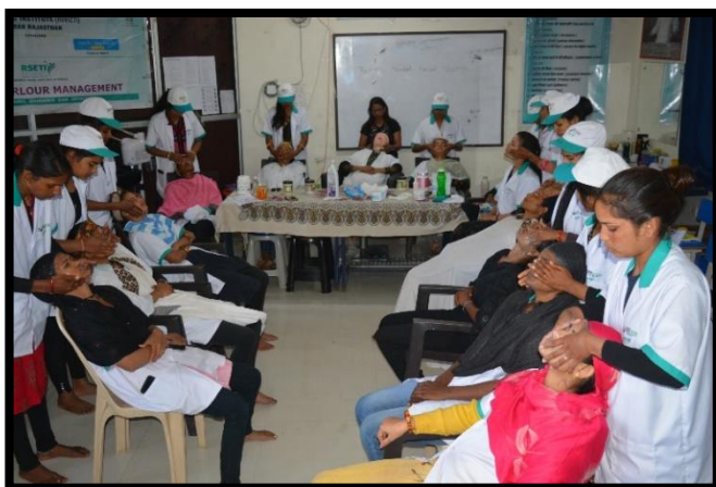
Trainees Participating in the Practical Session of Beauty Parlour Management Training Programme..