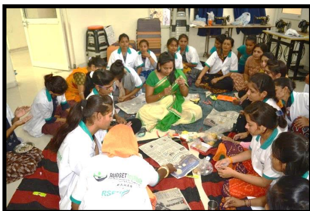
Trainees during the practical session of Costume Jewelry Making Training Program