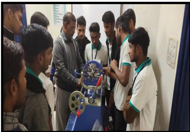
Trainees Participating in the Practical Session of Electric Motor Rewinding Training Programme.