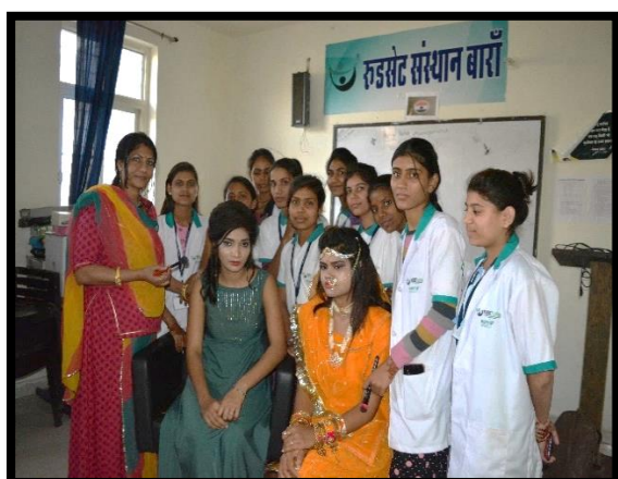
Practical Session Beauty Parlor Trainees