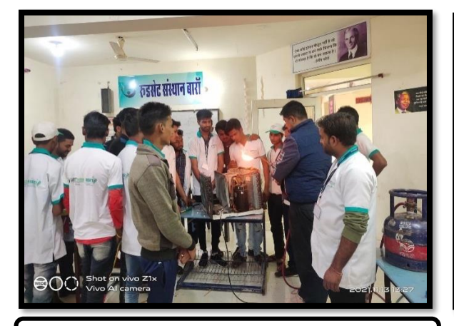
Practical Session Refrigeration & Air-conditioning Repair